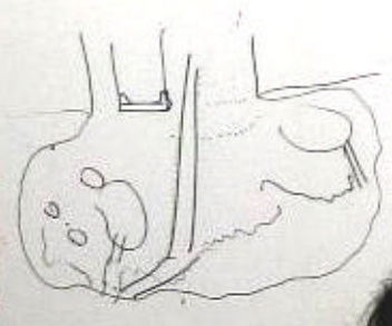
immagine del comunitario sistemato